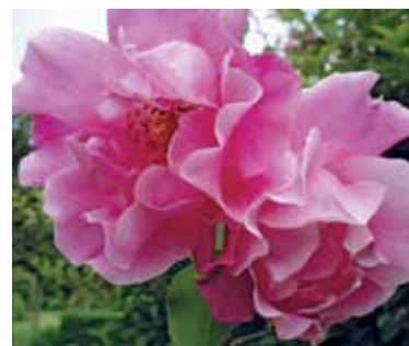
De zoete lathyrusgeur van Rosa 'Mme Grégoire Staechelin'.

Voor meer informatie: www.doaks.org/Studies_Programs/Garden_and_Landscape_Studies/Scholarly_Events .