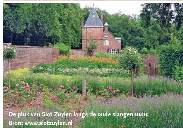
De pluk van Slot Zuylen langs de oude slangenmuur.