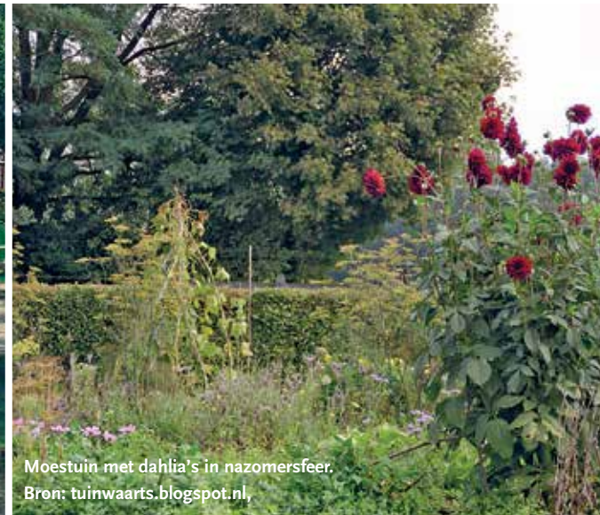
Moestuin met dahlia's in nazomersfeer.