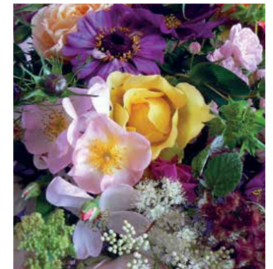
Het genot van een boeket uit eigen tuin.

Bij voorkeur komen de bloemen dan ook (weer) uit eigen tuin. Van vroeger uit is dat vaak een deel van de moestuin, ook omdat combinaties van bloemen en groentegewassen een natuurlijke ziekte- en plagenbestrijding vormen. Zo'n combinatie is mooi zichtbaar in de weer in gebruik genomen moestuin van Eyckenstein (Maartensdijk). Bij grotere snijbloembegroei bestaat de kwekerij vaak uit een gescheiden groente- en bloementuin. Dit is bijvoorbeeld het geval op Slot Zuylen (Oud Zuylen). Voor dat museum worden wekelijks circa twaalf boeketten geschikt, nagenoeg geheel uit eigen pluktuin. De vrijwillige 'bloemendames' hebben daarom nauw overleg met de tuinmensen over de te kweken soorten en aantallen. Het laatste aansprekende aspect van boeketten uit eigen tuin is daarmee dat het seizoensgebonden bloemen zijn. Zo zijn ook in het huis de seizoenen, met hun specifieke geuren, beleefbaar. Ruikt u het voorjaar al in huis?