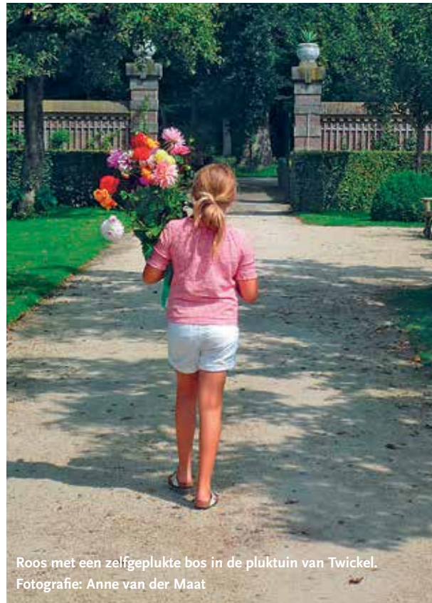
Roos met een zelfgeplukte bos in de pluktuin van Twickel.