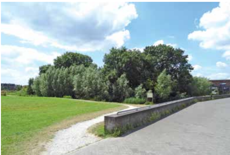
Het beboste kasteleiland, gezien vanaf het schoolplein aan de noordzijde van het park.

Recent hebben buurtbewoners en Stichting Abrona het plan opgevat om gezamenlijk een buurtmoestuin te beginnen. Onder leiding van Stichting de Wendig hebben zij bij gemeente Utrecht gevraagd om een plek in het wijkpark. Omdat het park archeologisch rijksmonument is, wil de gemeente dat nieuw gebruik aansluit bij de cultuurhistorische waarden. Uit mijn analyse van de historische ontwikkeling kwam de oude