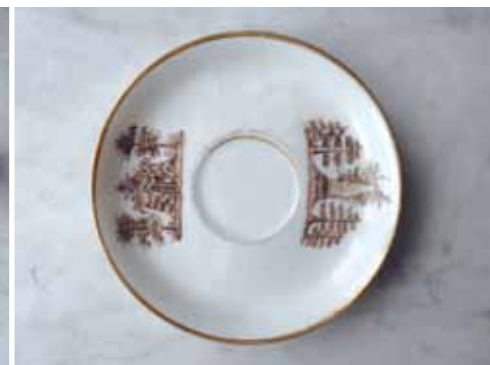
7 Schotel met afbeeldingen van twee tuinornamenten.