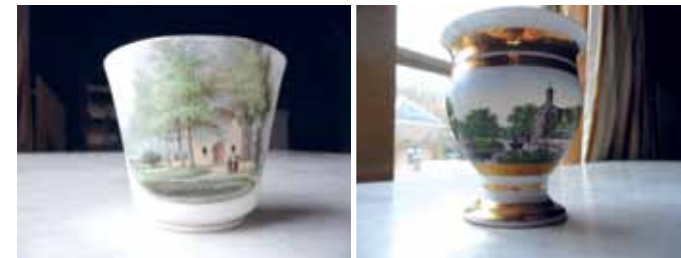
8 Kop en schotel met tuingebouw in de parkaanleg. 9 Kop met buitenplaats Rupelmonde.

Van een compleet servies waarop buitens 'naar het leven' zijn afgebeeld, zijn slechts enkele voorbeelden bekend. Daarnaast hebben veel buitenplaatsen een serviesstuk waarop het huis en een deel van de omgeving is weergegeven. Vaak zijn deze stukken gedecoreerd in opdracht van of door de eigenaars zelf, ter gelegenheid van een bijzondere gebeurtenis.