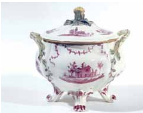
5 Terrine met afbeeldingen naar A. Rademaker.