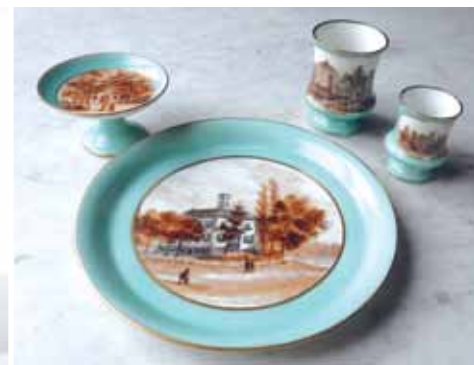
6 Rookstel met Gunterstein, tuingebouw, Oudaen en onbekend buitenhuis.