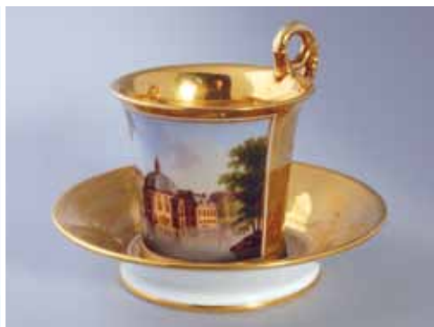
4 Theekopje met buitenplaats Trompenburg.