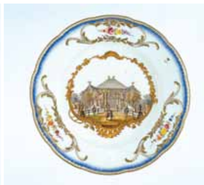
3 Bord van het servies voor Willem V, buitenhuis van de Gouverneur Generaal bij Jakarta.