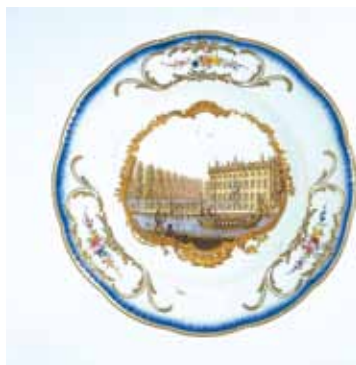
2 Bord van het servies voor Willem V, Huis ter Meer te Maarsse.