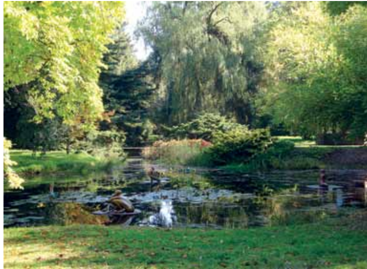
Boven en onder: Von Gimborn Arboretum.