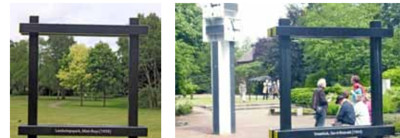
Vlnr: Toegangsbord tot het park van Weverij De Ploeg, gezien vanaf de oprijlaan naar de fabriek. Straatklok van Rietveld en Mien Ruysplantsoentje te Bergeijk