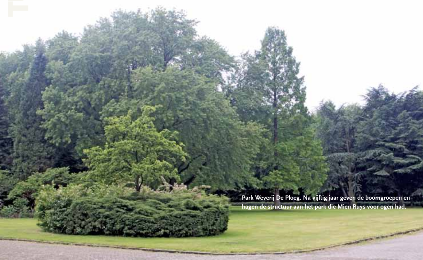
Park Weverij De Ploeg. Na vijftig jaar geven de boomgroepen en hagen de structuur aan het park die Mien Ruys voor ogen had.