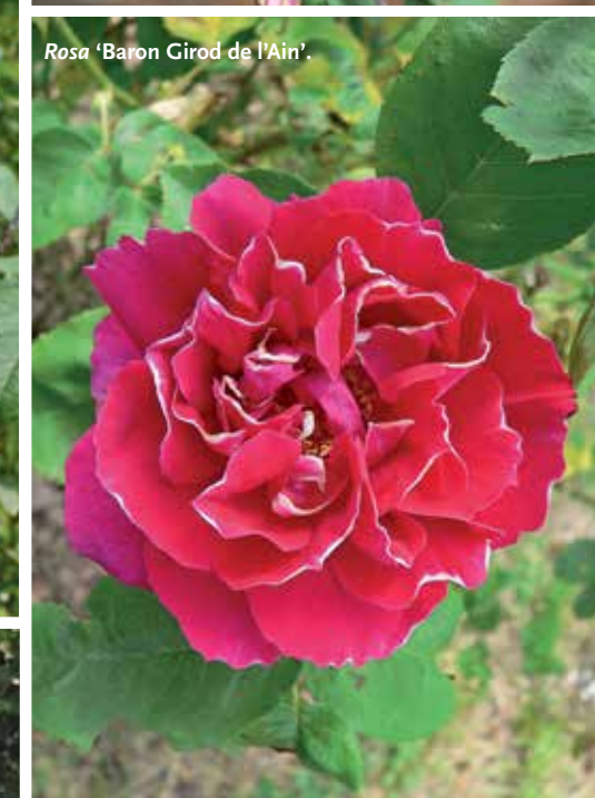
Rosa 'Baron Girod de l'Ain'.

Links van boven naar beneden: Bloeiende bomen van de Malus -collectie in het Belmonte Arboretum.