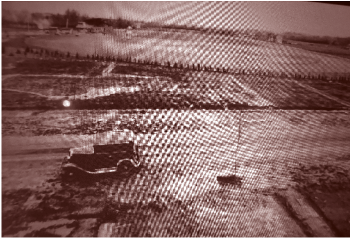
Aanleg van het Sportpark. Linksboven de tribune in aanbouw, rechts daarvan de jurytoren van de paardenrennen