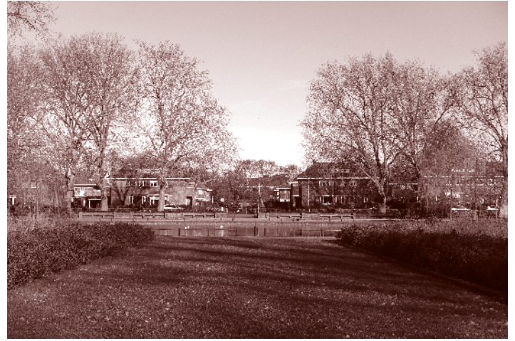
Noordelijk deel van het Stadspark met de zichtlijn naar het Julianaplein

Het langgerekte Stadspark is gelegen in het beekdal van de Geleenbeek tussen de wijken Ophoven en Kollenberg. Van oudsher was dit een moerassig broek- en bronnengebied, niet geschikt voor