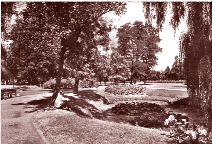
Stadspark: gedeelte bij de kleine vijver