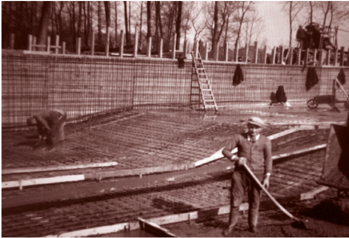
Aanleg van het zwembad in het Stadspark

leeftijd in zijn woonplaats Naarden. Na de oorlog wordt zijn kwekerij door de gemeente Naarden aangekocht en opgedoekt. Het woonhuis wordt omstreeks 1960 afgebroken.