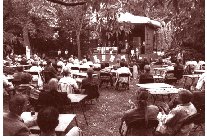
Concert bij de kiosk in het Burgemeester Damenpark

Vanaf de opening was het park een grote trekpleister en een echte ontmoetingsplek. Vele Geleners zullen zich herinneren dat ze als kind met hun ouders door het park hebben gewandeld, de eenden in de vijver hebben gevoerd of dat ze bij de dikke steen op de foto werden gezet. Op het zogenaamde "vrijerspaadje" hebben velen de