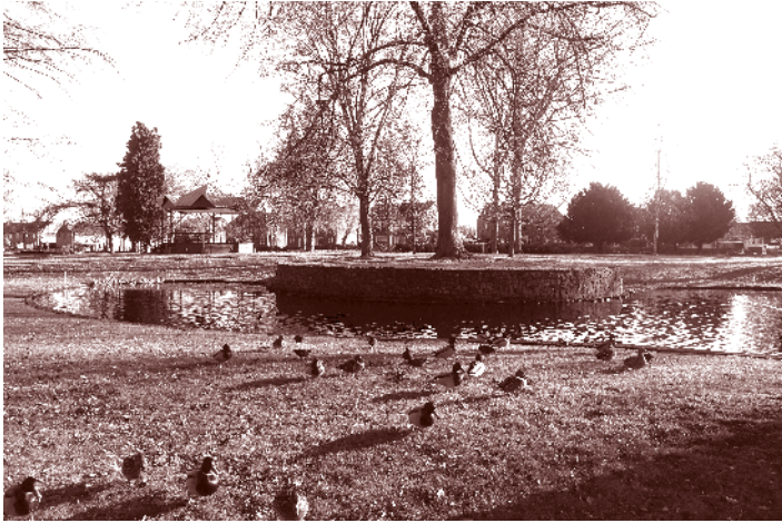
De kiosk en de vijver in het Burgemeester Damenpark

In 1941 raakte de tribune zwaar beschadigd door een bominslag en moest deze weer herbouwd worden. Acht jaar later verving men de grasbaan door een sintelbaan voor atletiekwedstrijden. De sintels werden geleverd door de Staatsmijnen. Burgemeester Damen zag atletiek als "... een machtig middel voor de opvoeding van de jeugd en het tegengaan van de baldadigheid." Later werd de baan geasfalteerd ten behoeve van de wielersport. In de winter kon het terrein gebruikt worden als natuurijsbaan.