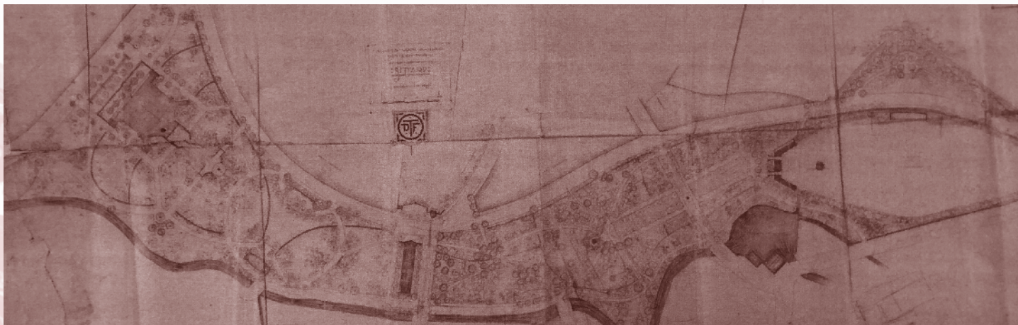
Ontwerp Stadspark Sittard uit 1920 met in het midden de langwerpige spiegelvijver getekend