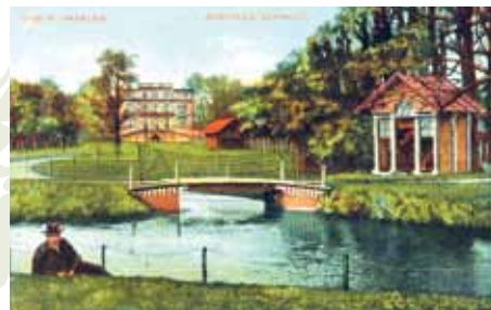
Gezicht op het huis Elswout te Overveen.

Bij onvoldoende deelnemers wordt de excursie geannuleerd.