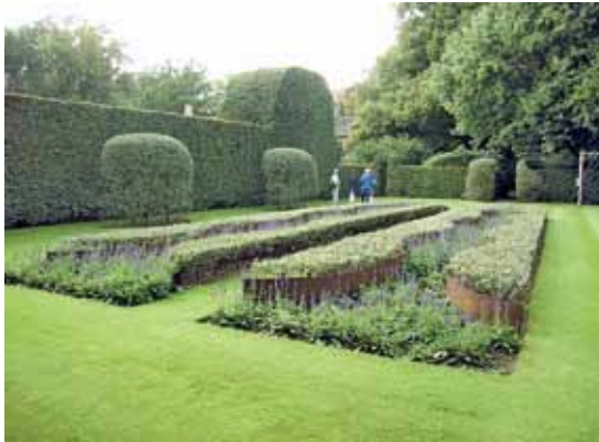
Een tuin van Piet Oudolf: geometrische hagen gecombineerd met golvende borders.