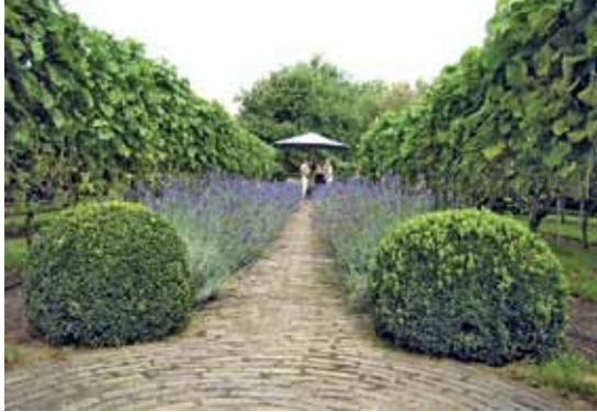
De Immenhof: prachtige tuin met borders en kronkelpaadjes.